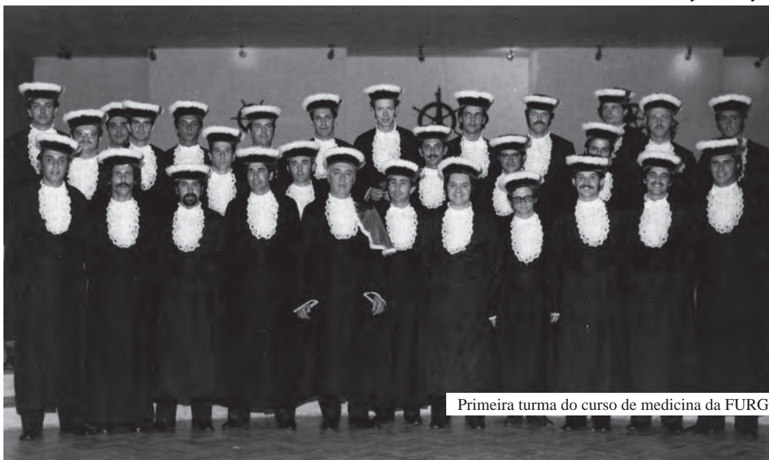
Primeira turma do curso de medicina da FURG