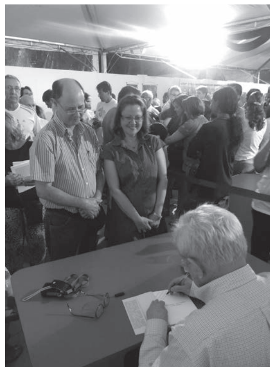
Sessão de autógrafos