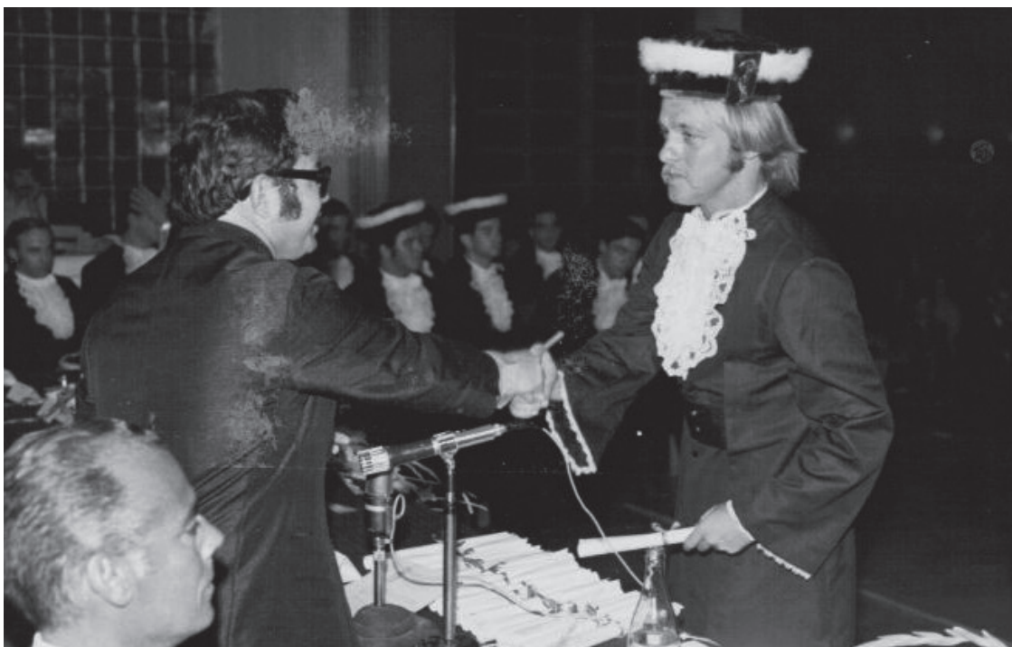
Professor entregando o diploma à primeira turma de formandos da Faculdade de Medicina da FURG

“O livro conta um pouco da vida do fundador da faculdade de medicina de Rio Grande e médico de grande prestígio não somente como profissional da medicina como também nas atividades em que se envolveu na comunidade.”